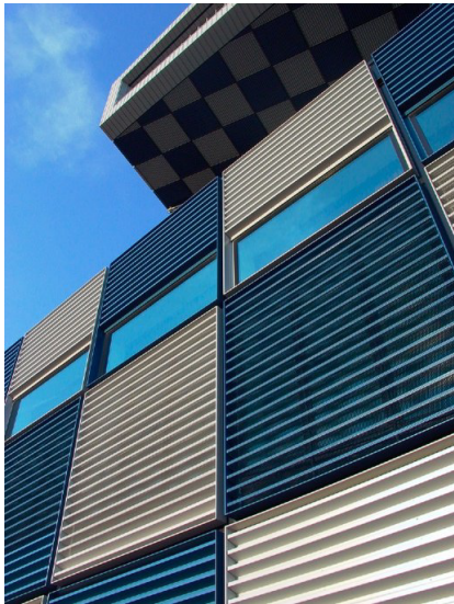
Shipping and Transport College Rotterdam, Niederlande Neutelings Riedijk Architects