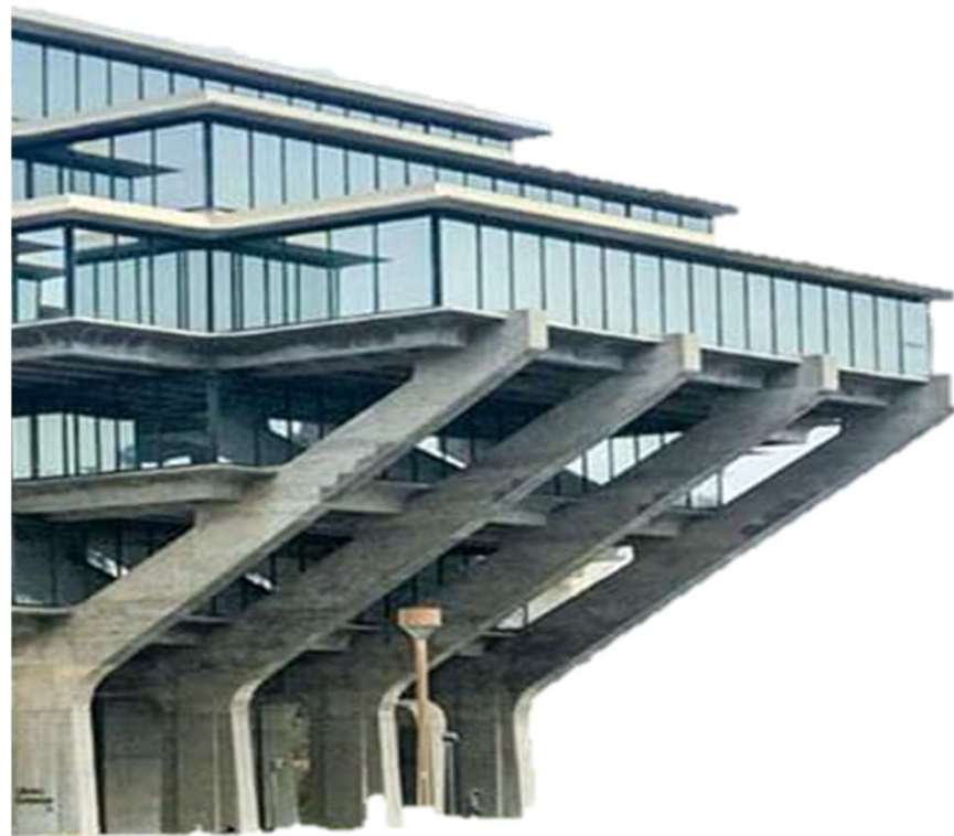
Geisel Library San Diego, Kalifornien